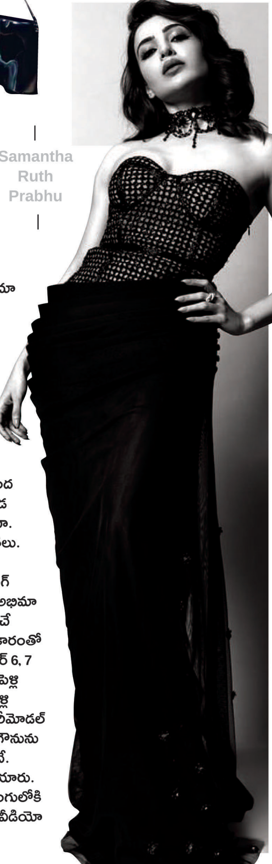
Samantha Ruth Prabhu