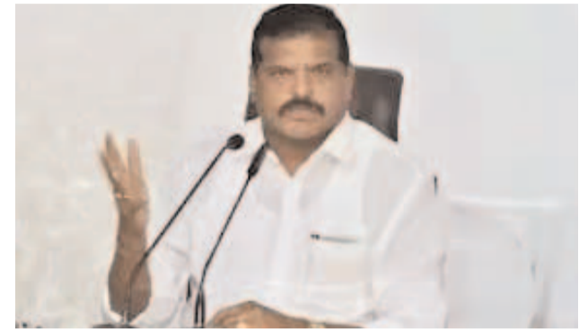
మాజీమంత్రి, వైఎస్సార్సీపీ సీనియర్ నేత బొత్తు సత్యనారాయణ