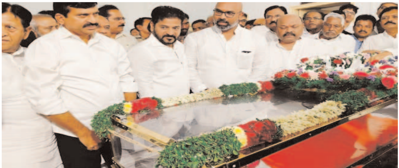
మన సాక్షి గొంతుక డెస్క్: