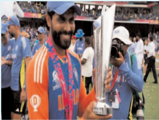
మన, సాక్షి గొంతుక డెస్క్:

భారత స్టార్ ఆల్రౌండర్ రవీంద్ర జడేజా..అంతర్జాతీయ టీ20 కెరీర్కు వీడ్కోలు పలికాడు. ఇప్పటికే పొట్టి ఫార్మాట్లు రోహిత్, కోహ్లా గుడ్ల చెప్పగా తాజాగా జడేజా కూడా ఈజాబిలితాలో చేరిపోయాడు. బ్రిడ్జింగ్: భారతస్టార్ ఆల్రౌండర్ రవీంద్ర జడేజా..అంతర్జాతీయ టీ20 కెరీర్కు వీడ్కోలు పలికాడు. ఇప్పటికే పొట్టి ఫార్మాట్లు రోహిత్, కోహ్లా గుడ్ల చెప్పగా తాజాగా జడేజా కూడా ఈ జాబిలితాలో చేరిపోయాడు. ఆది ఇన్స్పైరామ్ వేదికగా జడేజా తన రిటైర్మెంట్ నిర్ణయాన్ని ప్రకటించాడు.