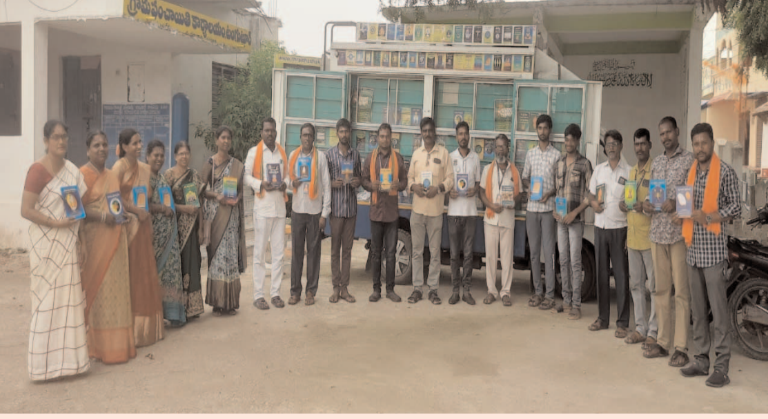
తైత సిద్ధాంత భగవద్గీత ప్రచారం మన సాక్షి గొంతుక ప్రతినిధి/యాదాద్రి భువనగిరి జిల్లా/అలేరు: