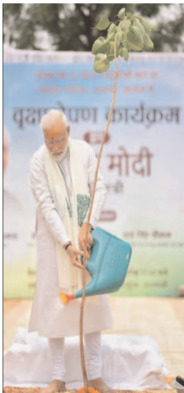
మన సాక్షి గొంతుక డెస్క్:

ప్రధానమంత్రి నరేంద్ర మోదీ 111వ ఎవిసోడ్ 'మన కీ బాత్' కార్యక్రమంలో ఆదివారం పలు అంశాలపై మాట్లాడారు. లోక్సభ ఎన్నికల అనంతరం తొలి మన కీ బాత్ కార్యక్రమంలో మోదీ పాల్గొన్నారు. పర్యావరణ దినోత్సవం సందర్భంగా 'ప్లాంట్ ఫర్ మడర్' పేరుతో కొత్త ప్రచారం చేపడుతున్నాం. అమ్మ పేరుతో నేను ఒక మొక్క నాటాను. మీరు మీ తల్లితో లేదా, మీ అమ్మ పేరుతో మొక్కను నాటండి' అని అన్నారు.