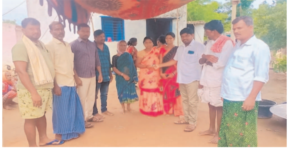
మన సాక్షి గొంతుక /జులై 03/రంగా రెడ్డి జిల్లా బ్యూరో