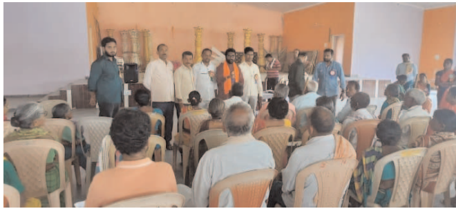
మన సాక్షి గొంతుక, జూలై 03. (చెన్నూర్)