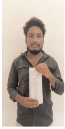
మన సాక్షి గొంతుక, జులై 03. (చెన్నూర్)