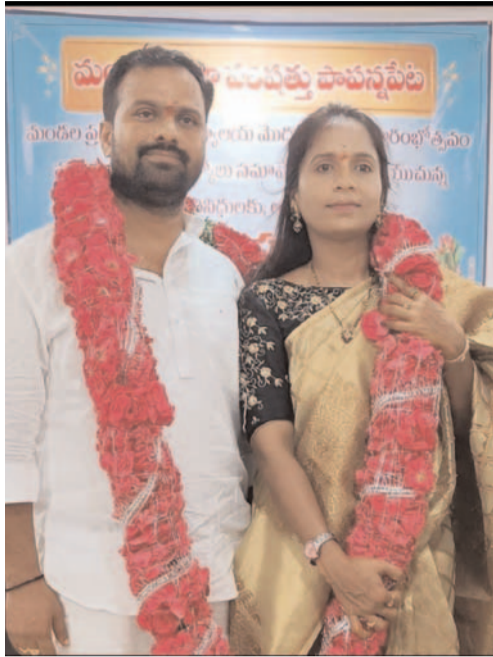
మనసాక్షి గొంతుక స్యూస్ పాపన్నపేట