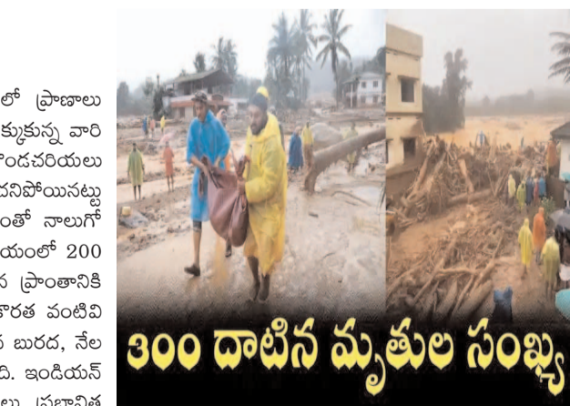
300 దాటిన మృతుల సంఖ్య

కేరళలోని వయనాడ్ ప్రకృతి స్పృష్టించిన విలయంలో ప్రాణాలు కోల్పోయిన వారి సంఖ్య 300 దాటింది. శిథిలాల కింద చిక్కుకున్న వారి కోసం సహాయక చర్యలు ఇంకా కొనసాగుతూనే ఉన్నాయి. కొండపరియలు విరిగిపడిన ఘటనలో ఇప్పటి వరకు 308 మంది చనిపోయినట్లు అధికారులు నిర్ధారించారు. డ్రోన్ ఆధారిత రాడార్ సాయంతో నాలుగో రోజు కూడా గాలింపు చర్యలు కొనసాగుతున్నాయి. విలయంలో 200 మందికిపైగా గాయపడ్డారు. భారీ వర్షాలు, ఘటన జరిగిన ప్రాంతానికి సజావుగా వెళ్లే పరిస్థితులు లేకపోవడం, భారీ పరికరాల కొరత వంటివి సహాయక చర్యలను ఆటంక పరుస్తున్నాయి. పేరుకుపోయిన బురద, నేల కూలిన వృక్షాలు, భవనాలను తొలగించడం కష్టంగా మారింది. ఇండియన్ ఆర్మీ, ఎన్డీఆర్ఎఫ్, కోస్టగార్డ్, ఇండియన్ నేవీ బృందాలు ప్రభావిత ప్రాంతాల్లో సహాయక చర్యల్లో పాలుపంచుకుంటున్నాయి. ఒక్కో బృందంలో ముగ్గురు స్థానికులు, అటవీశాఖ అధికారి కూడా ఉన్నారు. మొత్తం 40 బృందాలు ఆరు జోన్లుగా విడిపోయి సెర్చ్ ఆపరేషన్లో పాల్గొంటున్నాయి.