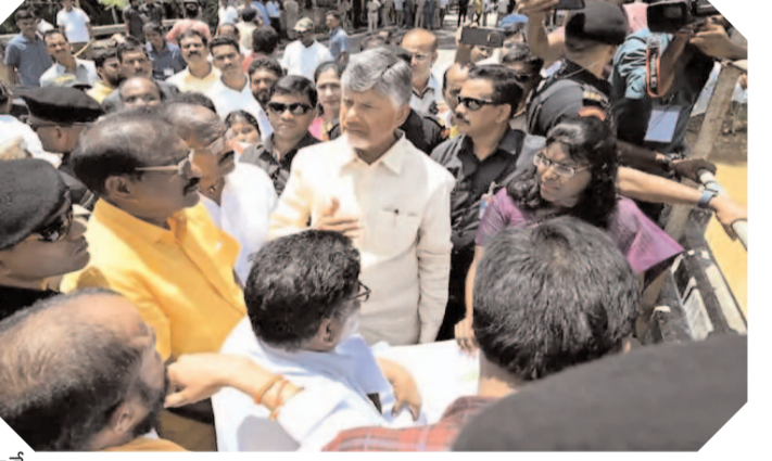
మన సాక్షి గొంతుక డెస్క్