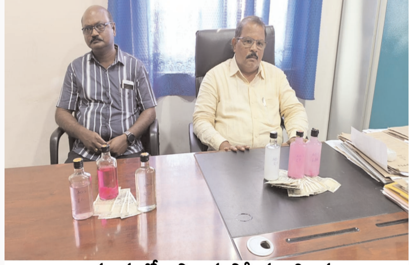
జనగామలో అనిశా కు చిక్కిన అధికారులు

మన సాక్షి గొంతుక న్యూస్ డెస్క్/హైదరాబాద్: