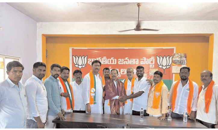
రాహుల్ గాంధీ చేసిన వాక్యాలు వెనక్కి తీసుకోవాలని డిమాండ్ చేశారు అన్ని వర్గాల ప్రజలు అభివృద్ధి ఎజెండా బీజేపీ డి,ఎస్సీలకు సమచిత స్థానం బీజేపీ పార్టీ లోనే ఇది ప్రజలు గమనిస్తున్నారా కాబట్టి మూడో సారి ప్రధాని బీజేపీ అభ్యర్థి శ్రీ నరేంద్రమోడి గారిని గెలిపించుకున్నారని, మీ మారు మాటలు ఎవ్వరూ నమ్మే స్థితిలో ప్రజలు లేరని పేర్కొన్నారు