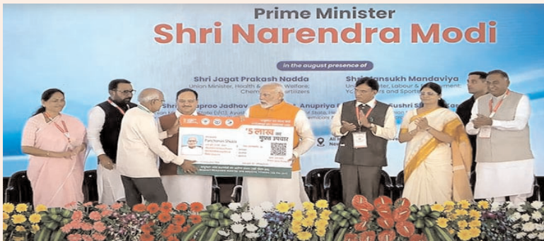
Prime Minister Shri Narendra Modi

మన సాక్షి గొంతుక డెస్క్ 'ఆయుష్మాన్ భారత్ ప్రధానమంత్రి జన్ ఆరోగ్య యోజన' కింద తీసుకొచ్చిన ఈ సదుపాయాన్ని ప్రధాని నరేంద్రమోదీ మంగళవారం ప్రారంభించారు. ధన్యుతరి జయంతి, తొమ్మిదో ఆయుర్వేద దే సంధర్భంగా ఈ పథకానికి ప్రధాని మోదీ శ్రీకారం చుట్టారు. కేంద్ర ఆరోగ్య శాఖ మంత్రి జేపీ నడ్డా ఈ కార్యక్రమంలో పాల్గొన్నారు. ఈ సందర్భంగా ఆరోగ్య రంగానికి సంబంధించిన పలు అభివృద్ధి కార్యక్రమాలతో పాటు, గర్భిణులు, చిన్నారుల వ్యాక్సినేషన్ కోసం ఉద్దేశించిన యూ-విన్ పోర్టల్ ను కూడా ఈ సందర్భంగా ప్రారంభించారు. దేశవ్యాప్తంగా ఆరు కోట్లమంది సీనియర్ సిటిజన్లకు ఈ పథకం ద్వారా లబ్ధి చేకూరుతుందని అంచనా. ఆయుష్మాన్ కార్డు ఉన్న వృద్ధులు కుటుంబ ప్రాతిపదికన ఏటా రూ. 5 లక్షల వరకు లబ్ధి పొందుతారు. అన్ని సామాజిక, ఆర్థిక వర్గాలకు చెందిన వృద్ధులకు వైద్యభీమా లభిస్తుంది. దీనికింద దరఖాస్తు చేసుకున్న వృద్ధులకు కొత్త కార్డులు అందిస్తారు. పథకం ద్వారా లబ్ధి చేకూరుతుందని అంచనా. ఆయుష్మాన్ కార్డు ఉన్న వృద్ధులు కుటుంబ ప్రాతిపదికన ఏటా రూ. 5 లక్షల వరకు లబ్ధి పొందుతారు. అన్ని సామాజిక, ఆర్థిక వర్గాలకు చెందిన వృద్ధులకు వైద్యభీమా లభిస్తుంది. దీనికింద దరఖాస్తు చేసుకున్న వృద్ధులకు కొత్త కార్డులు అందిస్తారు. ఇప్పటికే ఆయుష్మాన్ కార్డు పరిధిలో ఉన్న వృద్ధులకు ఇప్పుడు రూ. 5 లక్షల అదనపు కవరేజీ లభిస్తుంది. కుటుంబంలో 70 ఏళ్లపైబడిన వారు ఇద్దరు ఉంటే వారికి సగం, సగం ప్రయోజనం వర్తిస్తుంది. సీజీహెచ్ఎస్, ఎక్స్ట్రాస్ట్రెస్సెస్ కంట్రీబ్యూటర్ హెల్త్ స్కీం, ఆయుష్మాన్ సెంట్రల్ ఆర్ట్ పోలిస్ ఫోర్స్ పథకాల కింద ఉన్న వయోవృద్ధులు వాటిని గానీ, ఏటీఎంజెఎఫ్ఎస్ గానీ ఎంచుకోవచ్చు. ప్రైవేటు వైద్యారోగ్య భీమా, కార్యక్రమాలకు కూడా ప్రయోజనం పొందుతున్నవారూ ఈ రూ. 5 లక్షల ప్రయోజనం పొందొచ్చు.