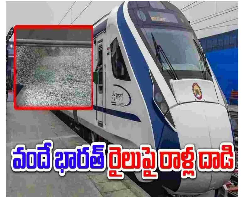
వందే భారత్ రైలుపై రాళ్ల దాడి

మన సాక్షి గొంతుక డెస్క్ వందే భారత్ రైలులో ఢిల్లీ నుంచి కాన్పూర్ వెళ్తుండగా ఉదయం 7.12 గంటలకు రైలు బులంద్ జిల్లాలోని కమల్పూర్ స్టేషన్ నుంచి దాటగానే, బయటి నుండి గుర్తు తెలియని వ్యక్తులు రాళ్ళు విసిరారని, దీంతో తన ముందు సీట్లలో కూర్చున్న ప్రయాణికుడి పక్కన కిటికీ అద్దాలు పగిలిపోయాయి.. వందే భారత్ రైలు కిటికీ అద్దం పగిలిన ఫోటోను చంద్రశేఖర్ ఆజాద్ ఎక్స్ పోస్టు చేశారు. ఈ ఘటన ప్రభుత్వ ఆస్తులకు నష్టం కలిగించడమే కాకుండా, ప్రయాణికుల భద్రతకు సంబంధించినదని ఎంపీ పేర్కొన్నారు. ఇటువంటి సంఘటనలను ఎట్టి పరిస్థితుల్లో అంగీకరించలేమని, ప్రతి ఒక్కరూ ఈ ఘటనలను ఖండించాలని అవసరం ఉందన్నారు. అలాగే ఇటీవల కాలంలో రైల్వే రాళ్ల దాడికి సంబంధించిన గణాంకాలను ఆయన ఎక్స్ పోస్టు చేశారు. 2022లో దాదాపు 1500కు పైగా ఇలాంటి ఘటనలు జరిగాయన్నారు. దీంతో రైల్వే శాఖకు కోట్లాది రూపాయల నష్టం వాటిల్లిందని చెప్పారు. ఇలాంటి సంఘటనలు పదే పదే ఎందుకు జరుగుతున్నాయో ఆలోచించాలన్నారు. రైల్వే రాళ్ల రువ్వడం వల్ల ఆస్తి నష్టం జరగడమే కాకుండా ప్రయాణికులకు ప్రాణాపాయం జరుగుతుందని ఎంపీ ఆవేదన వ్యక్తం చేశారు.