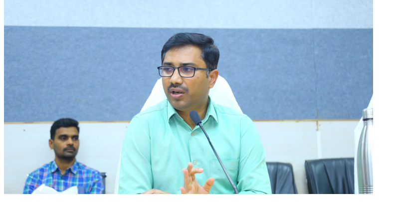
కేటాగజ్ ఆలకట్లించేందుకు సిద్ధమయ్యారు.