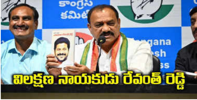
ఉండగా, రేపు (శుక్రవారం) ముఖ్యమంత్రి రేవంత్ రెడ్డి పుట్టినరోజు సందర్భంగా కాంగ్రెస్ పార్టీ శ్రేణులు ఎన్నో కార్యక్రమాలకు శ్రీకారం చుట్టారు.