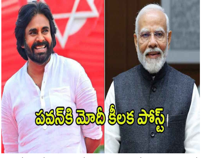
పవన్ కి మోటి కీలక పోస్ట్

మన సాక్షి గొంతుక డెస్క్ దేశవ్యాప్తంగా పులు రాష్ట్రాల్లో తెలుగు ఓటర్లు గణనీయంగా కనిపిస్తారు. ముఖ్యంగా దక్షిణాదిన వివిధ రాష్ట్రాల్లోని పలు సెగ్మెంట్లలో ప్రభావితం చేసే స్థాయిలో ఉన్నారు. అటు చూస్తే తెలుగు రాష్ట్రాల్లో విపరీతమైన ఫ్యాన్ ఫాలోయింగ్ ఉన్న పవన్ కళ్యాణ్ కి బాహారహితంగా అభిమానులకు కొదవలేదు. ఆ క్రమంలో బీజేపీ జనసేన అధ్యక్షుడైన తన బ్రంహ్మ కర్మగా మార్చుకుంటుందా? సనాతన ధర్మ సూత్రాలతో దేశవ్యాప్తంగా ఫోకస్ అవుతున్న జనసేనాని ఎన్నోపీ కూటమికి స్టార్ క్యాంపెయిన్ కానున్నారా? మొన్న తెలంగాణ నిన్న ఆంధ్ర ప్రదేశ్లో పవన్ చూపింది.. మహారాష్ట్ర ప్రచారంలో సత్తా చాటుకున్న ఏపీ డిప్యూటీ సీఎం నెక్స్ట్ టార్గెట్ ఏంటి? మహారాష్ట్ర ఎన్నికల్లో బిజెపి సారథ్యంలోని మహాయుతి- ఎన్నోపీ కూటమి అఖండ విజయం సాధించింది. ఈ విజయంలో జనసేనాని, ఏపీ ఉప ముఖ్యమంత్రి పవన్ కళ్యాణ్ పాత్రను తప్పకుండా ఒప్పుకోవాల్సిందే. పవన్ ప్రచారం చేసిన షోలాపూర్, పూణే, లాతుర్, బల్లార్ పూర్, కనబపేట్, దేగులూర్, భోకర్ లాంటి చోట్ల అధిక స్థానంలో బిజెపి కూటమి గెలుపొందింది. ముఖ్యంగా పవన్ కళ్యాణ్ ప్రచారం చేసిన నియోజకవర్గాల్లో అద్భుతమైన రెస్పాన్స్ లభించింది. ఆయా ప్రాంతాల్లో పవన్ నభలకు ప్రజలు స్వచ్ఛందంగా పోలిస్తారు. మరలా గడ్డపై తెలుగు ప్రజల సంఖ్య ఎక్కువగా ఉన్నచోట్ల